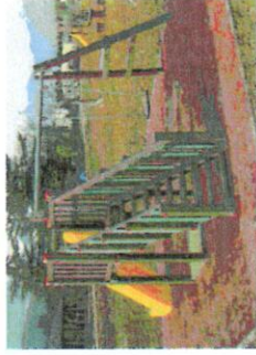
N.1 SCIVOLO ALTALENE