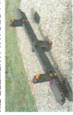
N.2 ELEMENTI BILICO