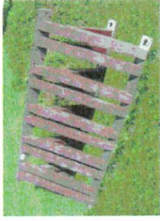
N.1 PORTA BICI 5 POSTI