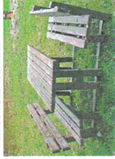
N.2 ELEMENTI TAVOLO PIC NIC